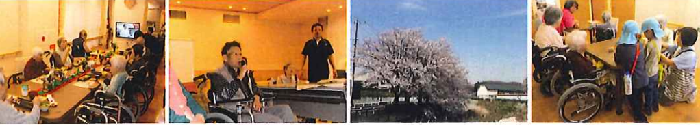
食事形態に合わせバランスの良い食事を提供 カラオケ、書道など希望に沿った趣味活動 家庭菜園や近隣ドライブ 近隣の保育園児との楽しい交流